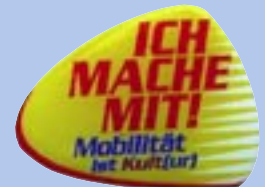
Offset-Druck Auf rostfreiem Stahl.