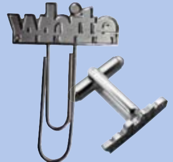
Büroclip und Manschettenknopf