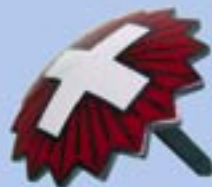
Heissemail Bombiert, Hutnadel.