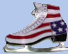
A-Qualität mit Glitter