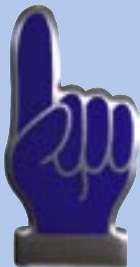
Druck auf Alu