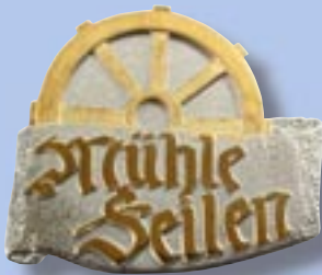
Gestanzt Gold und silber, sandgestrahlt.