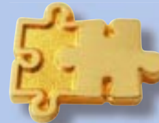
18K Gold Zertifiziert.